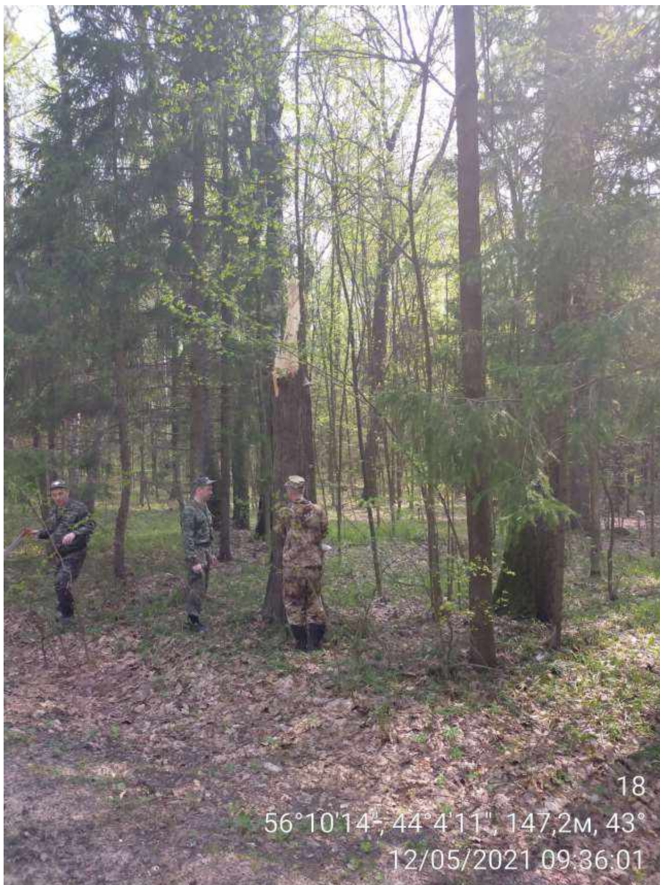
Дерево № 18 (Стволовая гниль)